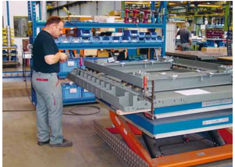
Bild 4 Ein typischer Steharbeitsplatz an einer Scherenhubbühne.

Im Stehen wird mit Vorteil dann gearbeitet, wenn der Greifraum oft überschritten wird, oder bei Tätigkeiten, die viel Körperkraft erfordern (Bild 4).