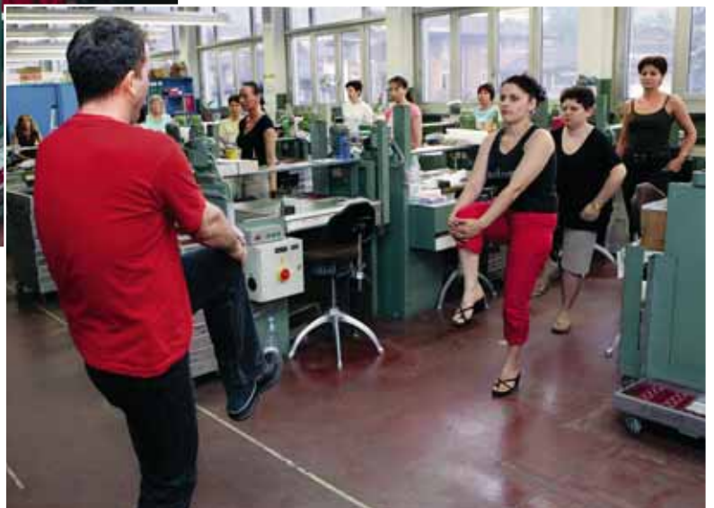
Bild 31 Knie anheben und halten, Fuss kreisen.