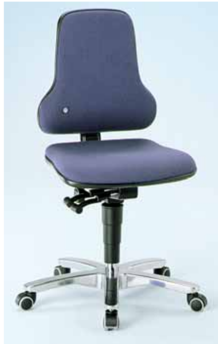
Bild 14 Arbeitsstuhl mit Synchronmechanik und Sitzneigungsverstellung.