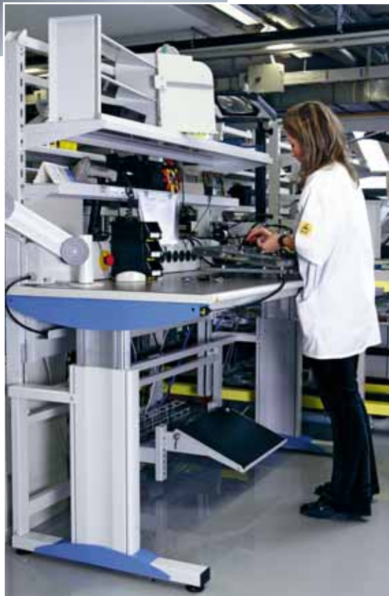
Bild 2 ...als auch stehend gearbeitet werden.

Ob im Sitzen oder Stehen gearbeitet werden soll, hängt in erster Linie von der zu verrichtenden Arbeit ab. Wichtig ist in jedem Fall die Bewegungsfreiheit: Es muss genügend Platz vorhanden sein für Beine und Füße und für die Handhabung von Werkstücken, Werkzeugen und anderen Hilfsmitteln.