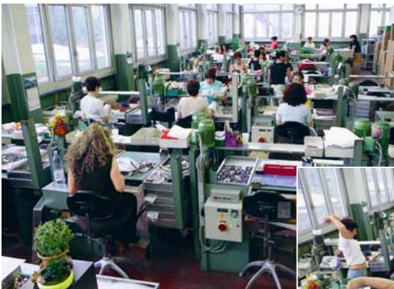
Bild 26 Die Körperhaltung bei dieser feinmotorischen Arbeit ist einseitig.

Nachfolgend das Beispiel eines Unternehmens, bei dem die Mitarbeitenden 2 mal pro Tag abteilungsweise direkt an bzw. neben den Arbeitsplätzen Ausgleichsübungen machen. Die Teilnahme ist freiwillig und erfolgt während der regulären Arbeitszeit. Davon Gebrauch machen im Schnitt ca. drei Viertel der Belegschaft. Die Übungen haben einen sehr positiven Einfluss auf das Wohlbefinden. Die körperlichen Beschwerden konnten dadurch eindeutig reduziert werden.