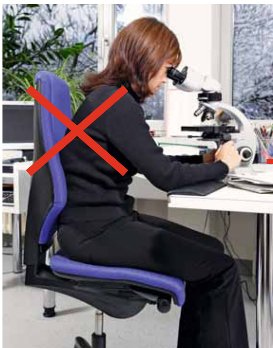
Bild 5 Gebeugte Haltung des Oberkörpers im Sitzen: Das Mikroskop ist zu niedrig.

Der Arbeitsgegenstand ist nach Möglichkeit immer in eine Position zu bringen, die es erlaubt, in aufrechter und natürlicher Haltung zu arbeiten. Das lässt sich oft mit einfachen Hilfsmitteln erreichen, wie die folgenden Beispiele zeigen: