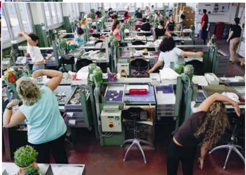
Bild 27 Um körperliche Beschwerden zu vermeiden, werden 2 mal pro Tag Ausgleichsübungen am Arbeitsplatz gemacht.