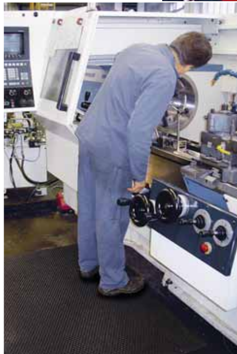
Bild 21 Steharbeitsplatz mit Ergo-Matte.