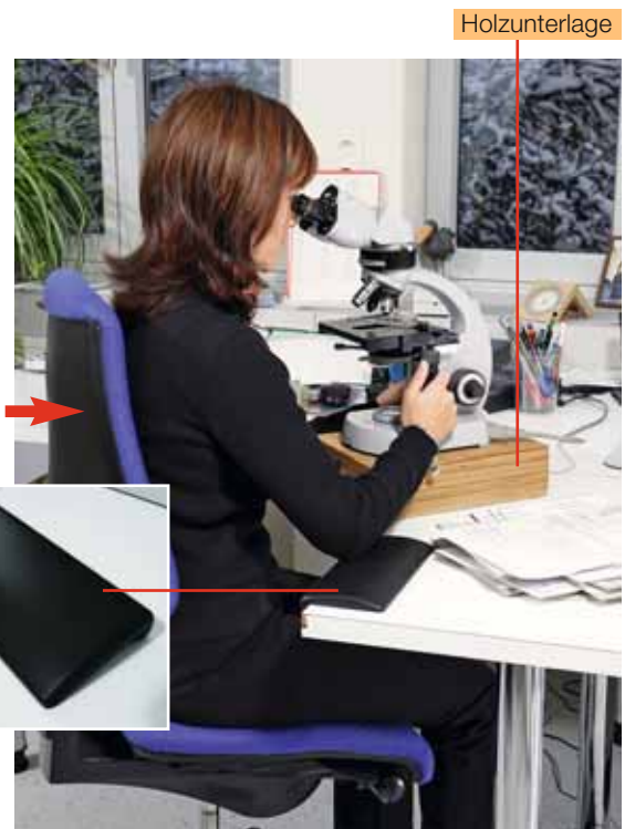
Bild 6 Die Holzunterlage ermöglicht eine korrekte Körperhaltung. Eine Arm- oder Ellbogenauflage «entschärft» kantige Tischplatten.