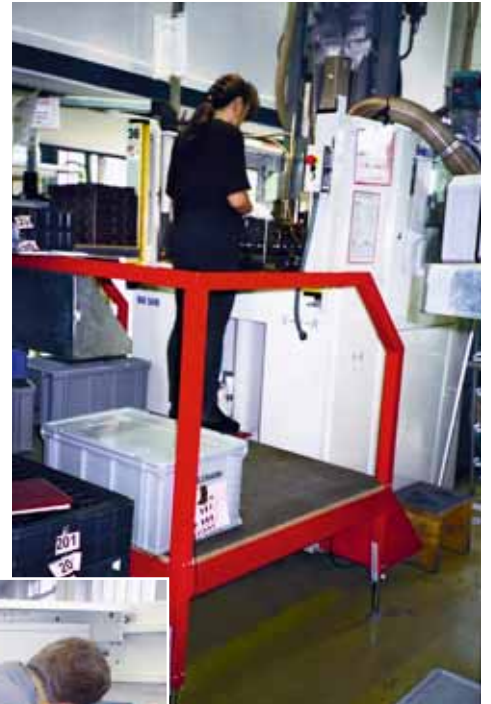
Bild 20 Elektrisch höhenverstellbares Arbeitspodest.