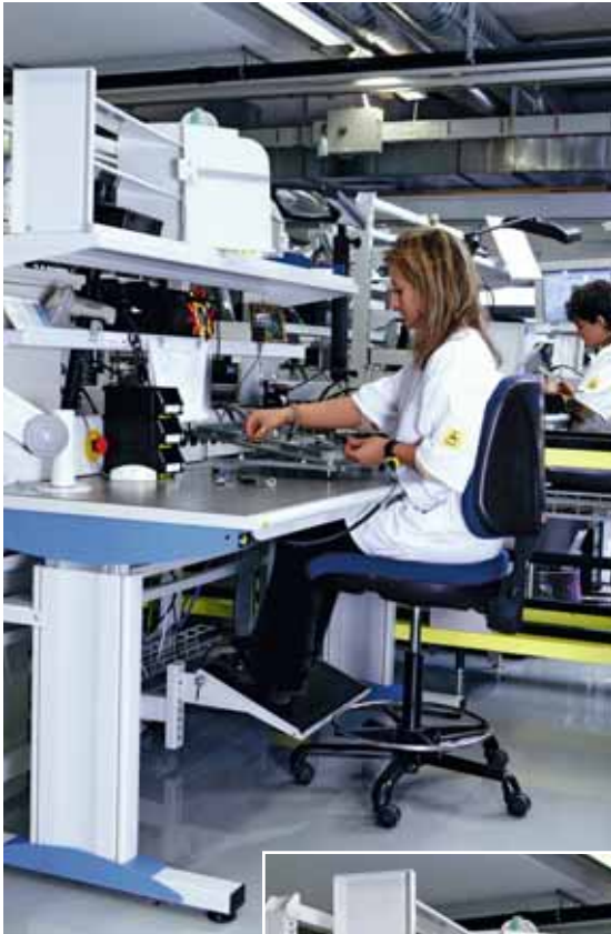
Bild 1 Hier kann sowohl sitzend....