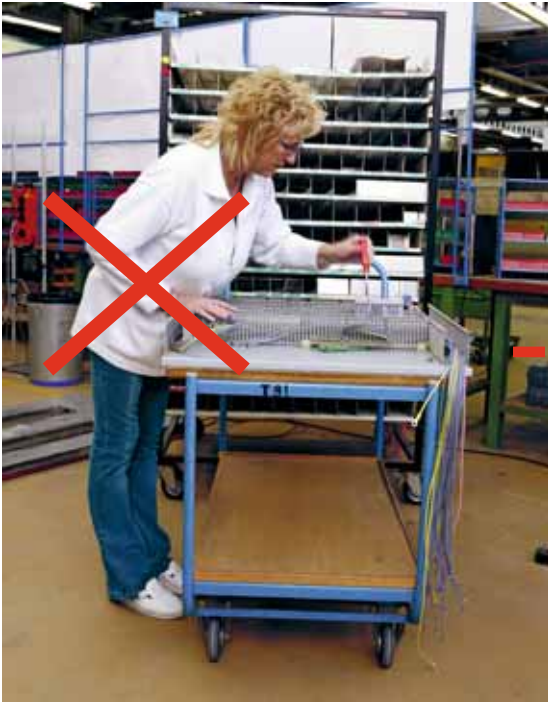
Bild 7 Gebeugter Oberkörper im Stehen: Der Wagen eignet sich nicht als Montageunterlage.