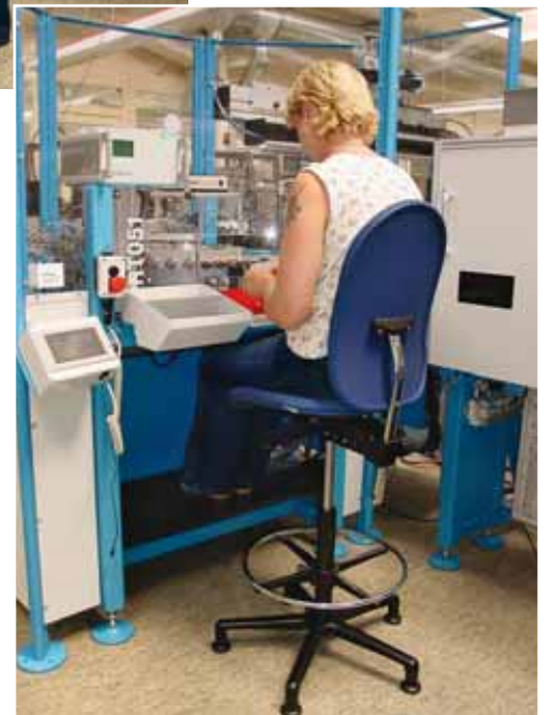
Bild 25 Mit korrekter Sitzeinstellung und Fussstütze kann auf gleicher Höhe gearbeitet werden wie beim Stehen.