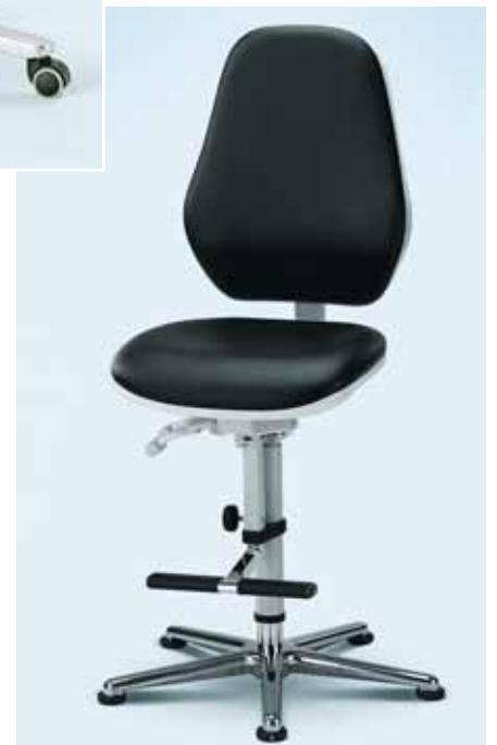
Bild 15 Arbeitsstuhl mit höhenverstellbarer Aufstiegshilfe.