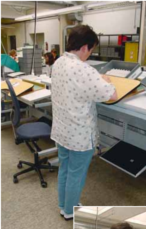
Bild 22 Schritt 1, Arbeitsfläche einstellen beim Arbeiten im Stehen.