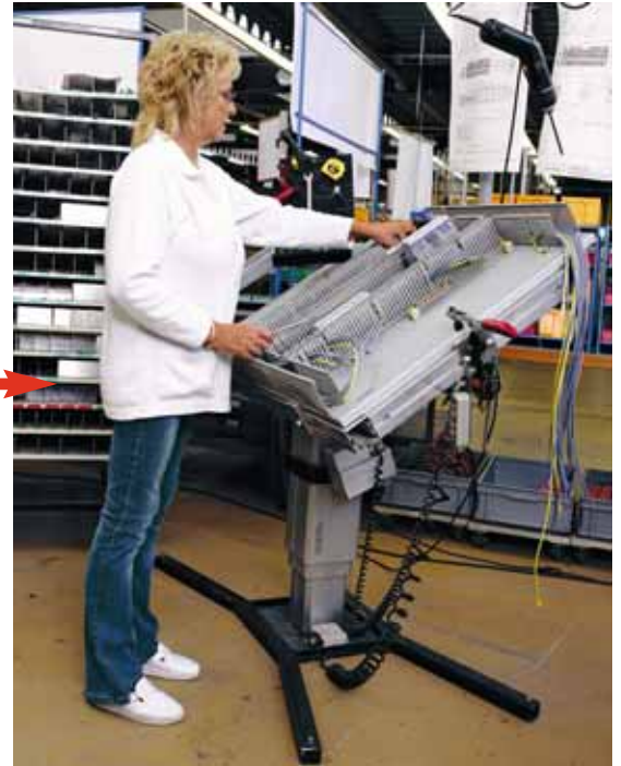
Bild 8 Der höhenverstellbare und neigbare Montageständer ermöglicht eine korrekte Körperhaltung.

Bei feinmotorischen Arbeiten müssen die Unterarme und/oder Hände abgestützt werden können; je nach Tätigkeit entweder direkt auf dem Arbeitstisch oder auf speziellen, fest installierten oder beweglichen Ablagen oder Armschalen. Materialien wie Glas, Marmor oder Metall fühlen sich eher kalt an und eignen sich nicht zum Abstützen. Auch scharfe Kanten von Maschinentischen, Schubladen, Vorrichtungen usw. sollten nicht zum Abstützen benutzt werden. Scharfe Kanten können in vielen Fällen mit handelsüblichen Armauflagen aus Kunststoff oder Gummi gepolstert werden (s. auch Bild 6).