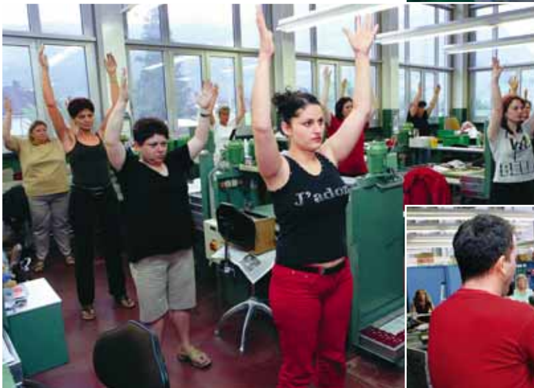
Bild 30 Arme heben, Hände öffnen und schliessen.