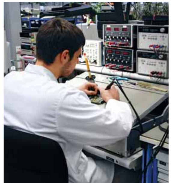
Bild 9 Für kleinere Arbeiten genügt ein neigbarer Rahmen auf dem Tisch. Die hinten angehobene Platte erleichtert den Einblick.