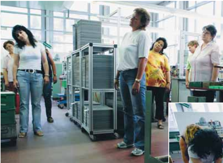
Bild 28 Kopf langsam zur Seite neigen.