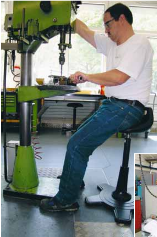
Bild 16 Stehhilfe zur Entlastung der Beine.

Reine Steharbeitsplätze sollten nur dann eingerichtet werden, wenn das Arbeiten im Sitzen nicht möglich oder nicht sinnvoll ist. Dies kann der Fall sein bei Arbeiten, die viel Platz und Körperkraft erfordern.