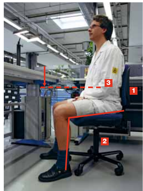
Bild 11 1. Füße auf den Boden stellen. 2. Sitzhöhe einstellen. 3. Tischhöhe anpassen.