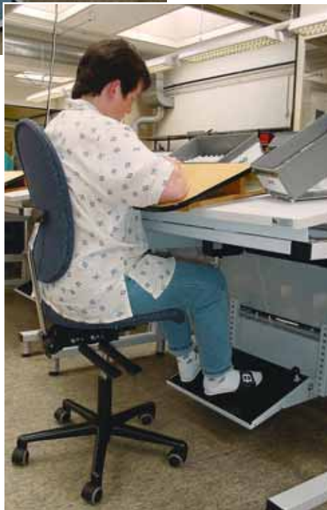
Bild 23 Schritt 2, Sitzhöhe und Fussstütze einstellen.

Am besten ist es, wenn abwechselnd im Sitzen und Stehen gearbeitet wird. Dadurch verschafft man sich mehr Bewegung und vermeidet einseitige Haltungen. Ideal ist ein höhenverstellbarer Arbeitstisch. Oft kann aber auch an Werkbänken und Maschinen, bei denen sich die Höhe der Arbeitsfläche nicht verändern lässt, abwechselnd im Sitzen und Stehen gearbeitet werden. Dafür müssen aber die Voraussetzungen bezüglich Greifraum, Kraftaufwand und Platz für die Beine erfüllt sein (s. Kapitel 1).