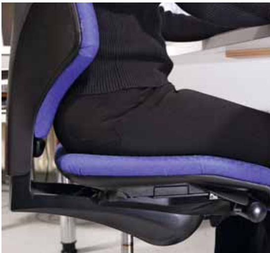
Bild 13 Lordosenstütze am oberen Beckenrand.

Durch das Bewegen der Wirbelsäule werden die Bandscheiben mit Nährstoffen versorgt. Das heisst, langes Sitzen ohne Bewegung sollte vermieden werden – auch wenn die Haltung noch so gut ist.